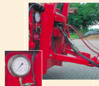
Auf Wunsch lieferbar: hydraulische Wiegeeinrichtung.