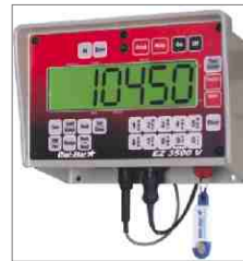
Auf Wunsch lieferbar: Elektronische Wiegeeinheit mit Datenübergabe (Datakey), Docking Station und Futter Manager Software.