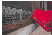
Hydraulisch höhenverstellbares Querförderband für Ausdosierung an einer Seite ist als Zusatzausrüstung lieferbar.