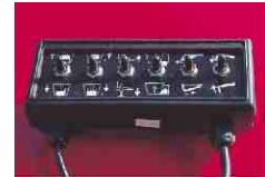
Serienmäßig ausgerüstet mit elektrischer Fernbedienung.