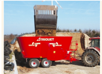
In einem Schnittvorgang ca. 3.25 m 3 Futter aus dem Silo schneiden und das in wenige Minuten.