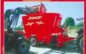
Verlustfrei transportieren. Effektiv und einfach laden.

Der Greifschaufel Silogrip ist serienmäßig ausgerüstet mit ein hydraulisches Greifwerkzeug mit sichelförmigen Greifzinken, zwei Gabelzinken an jeder Seite, manganstahl-Verschleißschienen, schnellkuppler gemäß Euronorm