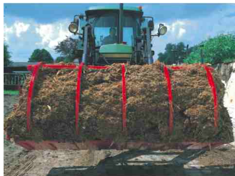
Durch die optimal geformten Greifzinken wird zum Schließen der Schaufel nur wenig Kraft benötigt.

Der Silogrip ist stabil und einfach gebaut und dadurch nahezu wartungsfrei. Mit anderen Worten eine Investition für Jahre.