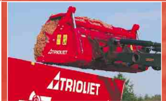
Fünf gebogenen Greifzähnen für dass problemlos ausnehmen von Gras oder Mais.