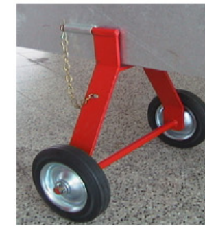
Fahrwerk für TM-Typen